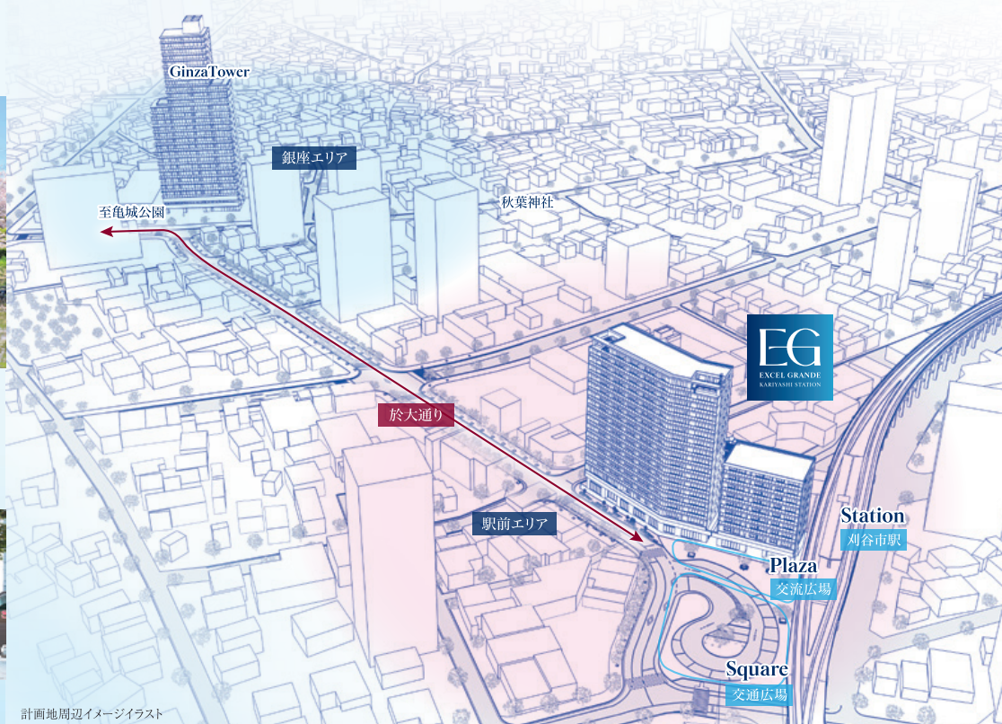
計画地周辺イメージイラスト