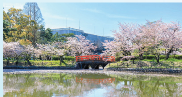
亀城公園 / 約890m・徒歩12分

名鉄三河線「刈谷市」駅前から銀座エリアに向かう「於大通り」に沿って、次世代の街づくりが 計画中です。本物件（エクセルグランデ刈谷市駅）は、そのファーストプロジェクトとして、その姿を現します。 そのシルエットは、高層17階建のツインレジデンス、シルクのようなホワイトを基調とし、街並に響きあい、 遙か先から遠望すると、刈谷未来に架かる「虹」のようにも映ります。