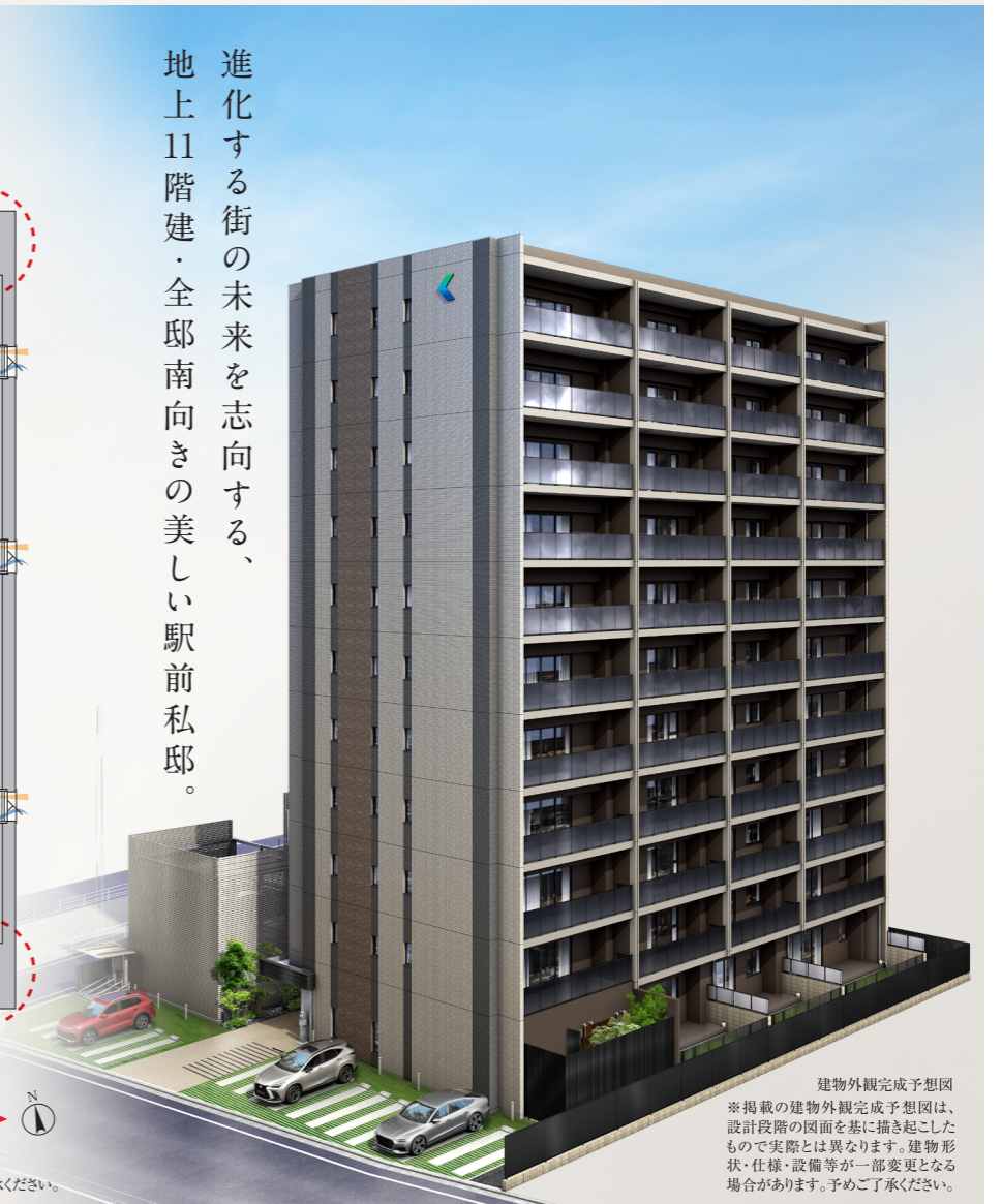
建物外観完成予想図 ※掲載の建物外観完成予想図は、設計段階の図面を基に描き起こしたもので実際とは異なります。建物形状・仕様・設備等が一部変更となる場合があります。予めご了承ください。