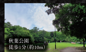
秋葉公園 徒歩1分(約10m)