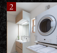
2 ガス衣類乾燥機「乾太くん」