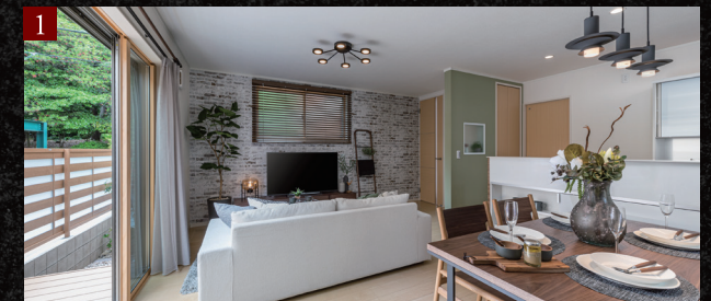
三面採光の明るいリビング