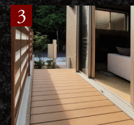
3 ウッドデッキ (F邸のみ)