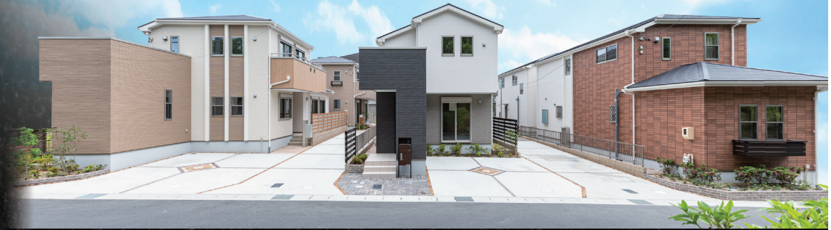
※外観撮影写真(2021年5月)

MODEL HOUSE | F邸 4LDK+WIC+納戸 敷地面積 134.71㎡(40.74坪) 延床面積 114.28㎡(34.56坪) 全居室南向き ウッドデッキ 独立和室 納戸