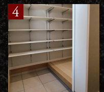
4 シューズクローク (D・F邸のみ)