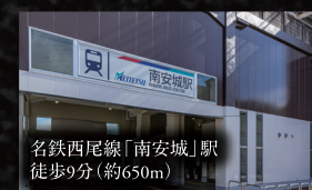
名鉄西尾線「南安城」駅徒歩9分(約650m)