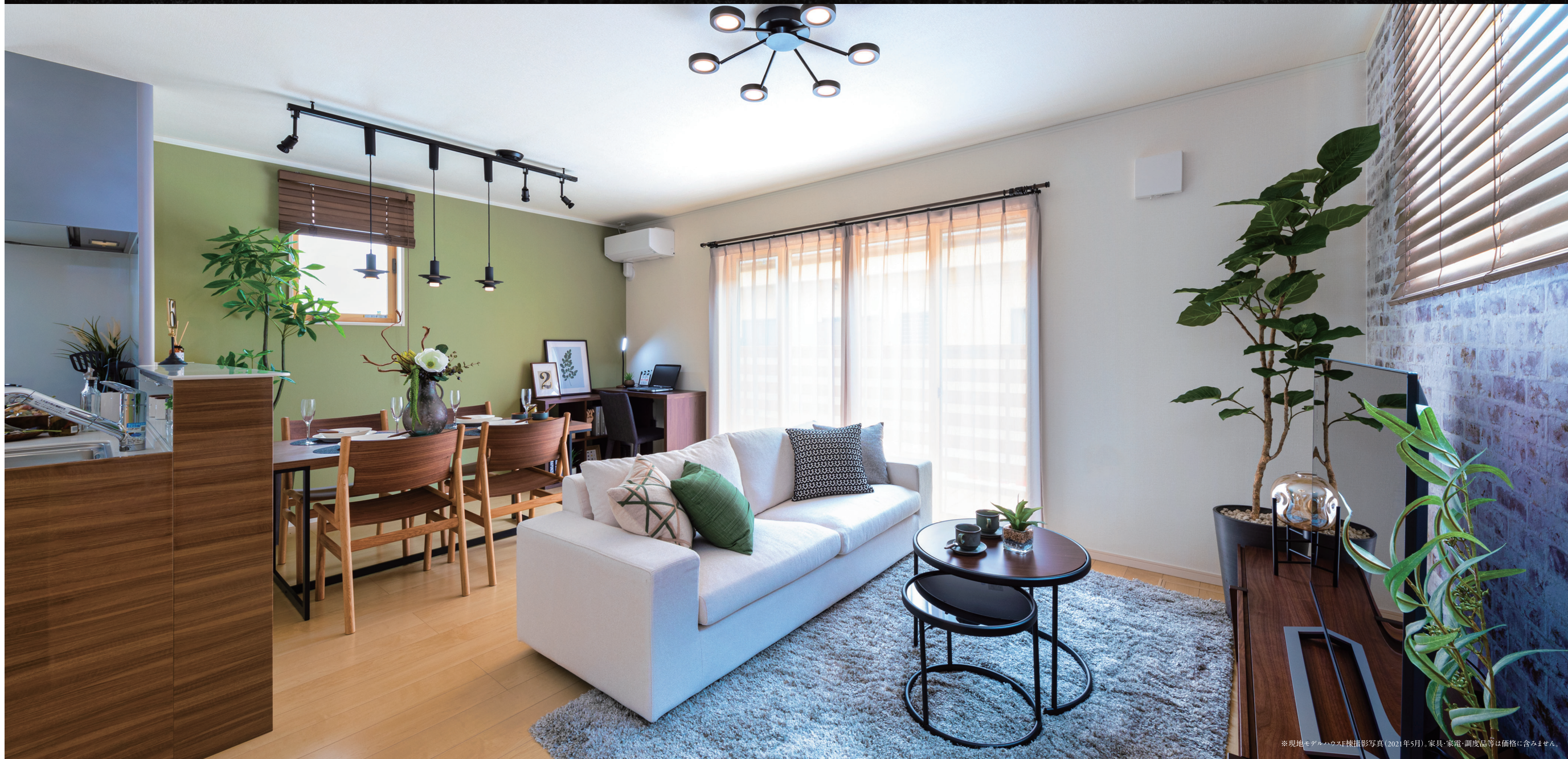
※現地モデルハウスF棟撮影写真(2021年5月)。家具・家電・調度品等は価格に含まれません。

| 全邸長期優良住宅 | 分譲住宅6邸 名鉄「南安城」駅 徒歩9分 (約650m) JR「安城」駅 徒歩17分 (約1.330m)