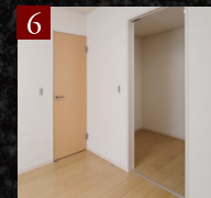
6 ウォークインクローゼット